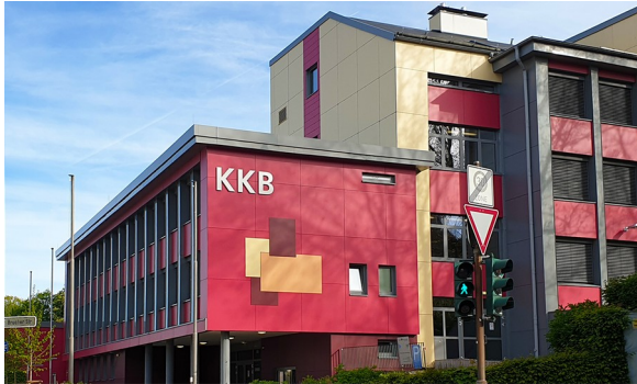
Hauptgebäude - Käthe-Kollwitz-Berufskolleg Freiheitstr.146, 42853 Remscheid